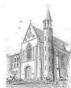
Parochie O.L.V. Onbevlekt Ontvangen Zenderen